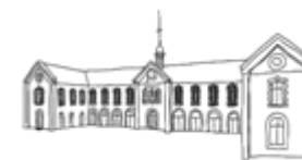
EHPAD Simon Hême

ou comment accompagner la transition domicile-EHPAD